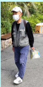
動物園内を散歩中